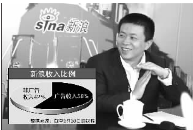
新浪CEO曹国伟雄心勃勃 资料图

事实上,网民自采内容是Web 2.0的一个突出特征,这也成就了今年强势崛起的新浪博客。不过,曹国伟的胃口并不仅限于此,目前新浪又在筹措自己的视频分享系统,不久前Google收购了全球最著名的视频分享网站Youtube,让国内更多地关注到了这一领域,