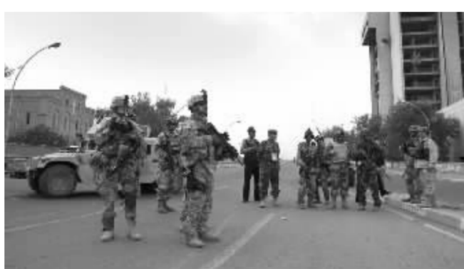
11月5日,伊拉克士兵在法庭外警戒

由伊拉克总统贾拉勒·塔拉巴尼和两名副总统组成的总统委员会批准。塔拉巴尼始终反对对伊拉克执行死刑,表示不会在死刑判决书上签字。