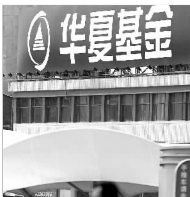
华夏旗下基金连连分红,使华夏基金公司深受投资者关注

华夏红利基金适时高比例分红,是华夏基金坚持通过有效分红政策为投资者获取回报的一个体现。