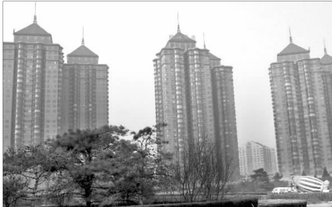
鹏润家园的一系列相关交易正在逐一浮出水面 资料图

黄光裕“兄弟二人从来都是假借其他公司的名义从北京中行贷款”,有知情人士这样断言。