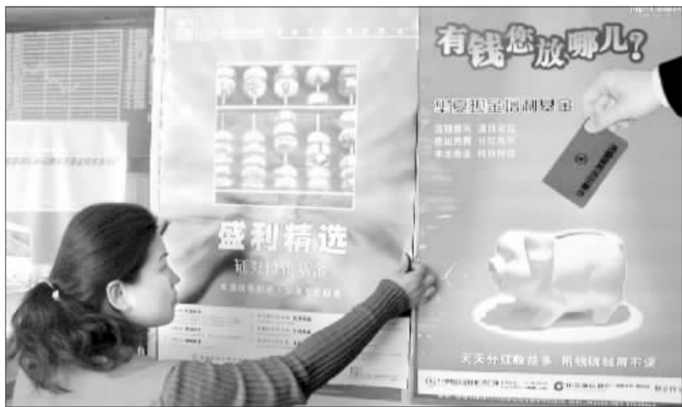
近来,基金不断运用新的手段推动持续营销。

而中海分红增利基金由于持续大比例分红将其净值降至面值附近,也取得了非常好的二次营销效果。三季度季报显示,截至中海分红增利的总份