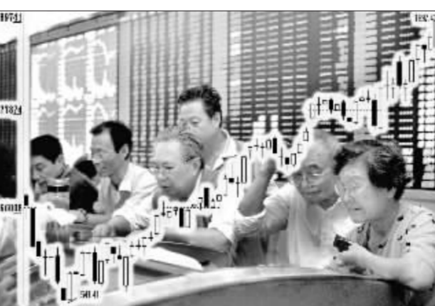
多数基金看好四季度行情。徐汇 资料图 张大伟 制图

景顺长城基金日前发布11月份投资策略报告认为,宏观调控措施初见成效和宏观经济健康发展、上市公司业绩增长超出市场预期、人民币升值加速提升 A 股长期吸引力等三大因素助推 A 股市场继续向好。