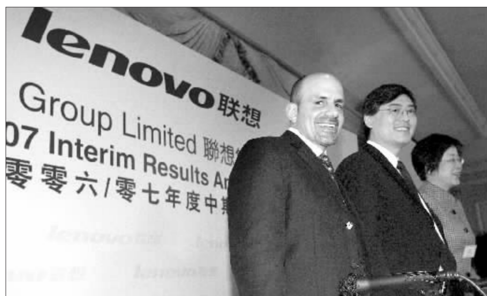
杨元庆看好新兴市场业务 资料图

杨元庆承认,联想品牌对于北美消费者的认知程度不够,同时,联想在北美市场的参与度不高,而且北美市场的规模小,缺乏大客户,都是小客户。目前联想