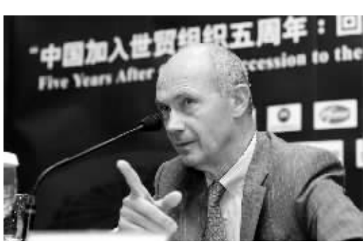
WTO总干事拉米高度评价中国入世五年表现 徐汇图