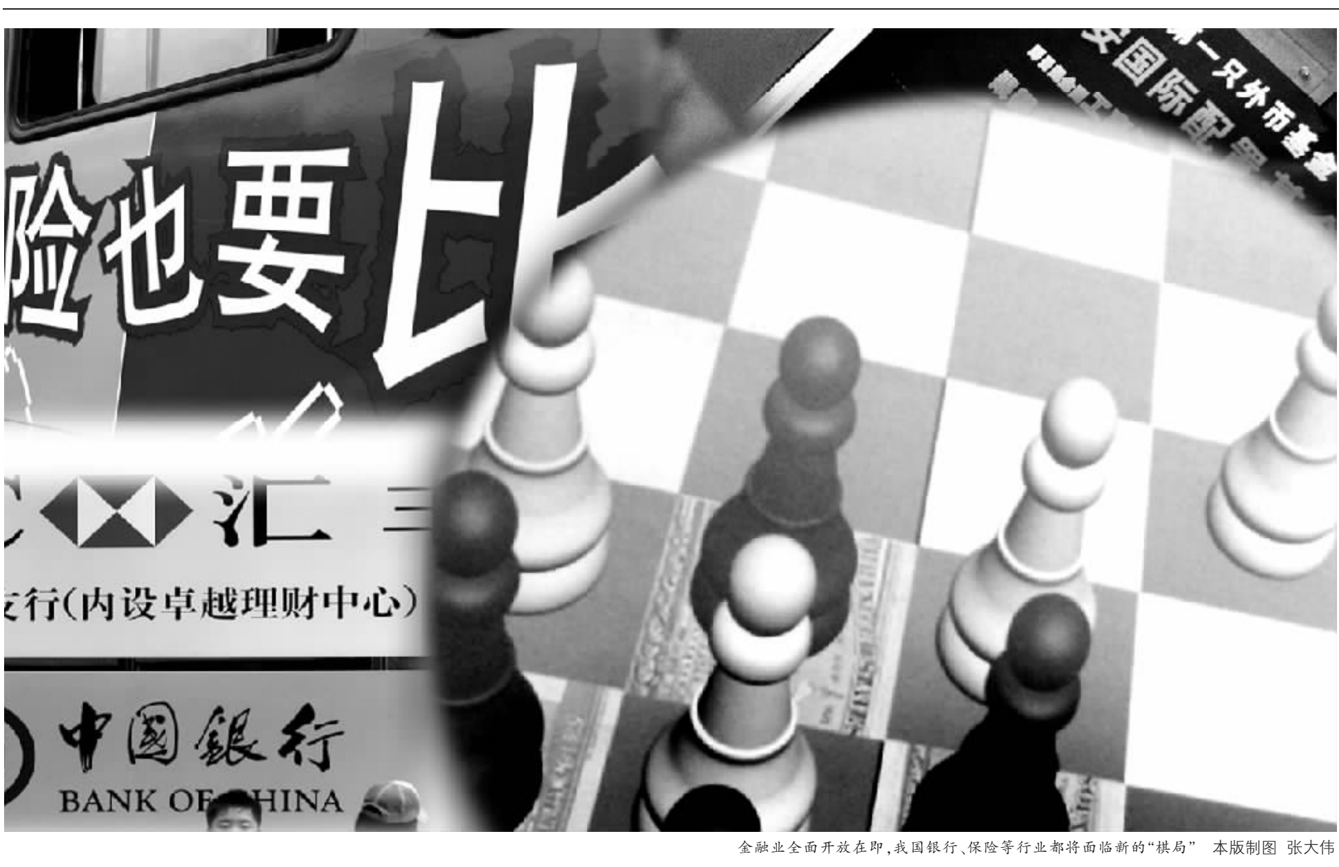
金融业全面开放在即,我国银行、保险等行业都将面临新的“棋局” 本版制图 张大伟