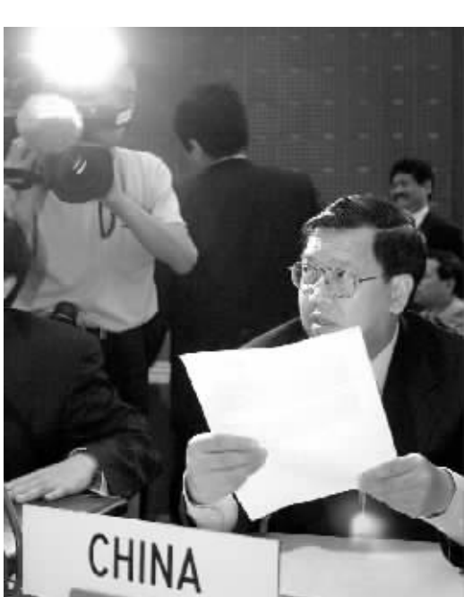
中国的入世举世瞩目