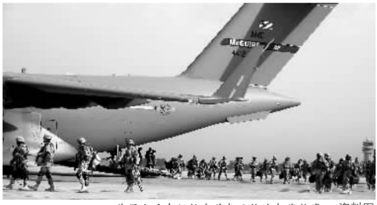
美军士兵在伊拉克首都巴格达卸载物资 资料图