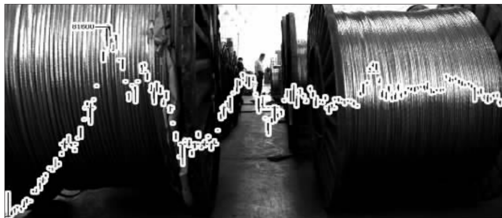
沪铜主力合约日K线图 张大伟 制图

“加工费如此大幅度地上涨表明目前铜精矿供应充裕,铜市场潜在供应将大幅增加。这些铜精矿主们此次要看中国冶炼企业脸色了。”一位业内人士分析道。种种迹象都表明,铜矿主们正在为将要发生的基本面“变局”而未雨绸缪,因为基本