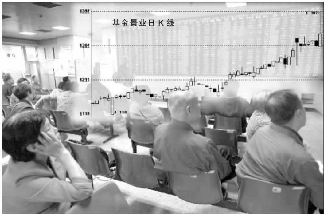
封转开一直是广大投资者关注的焦点 张大伟 制图

在审批了三只基金的“封转开”方案之后,管理层对基金公司提交方案的审批时间也有望缩短。这也为一些基金提前“封转开”铺平了道路。