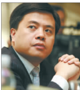
盛大首席执行官兼董事长陈天桥