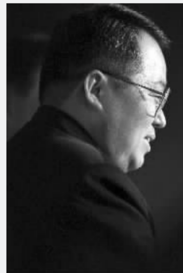
11月7日,科龙电器原董事长顾雏军在佛山市中级人民法院受审