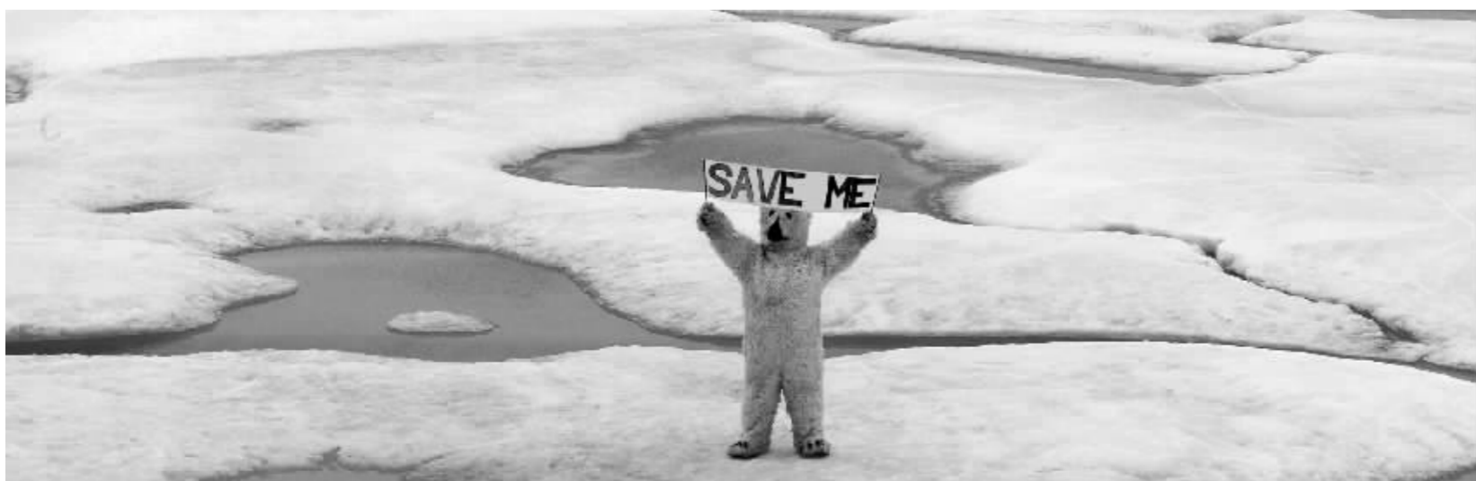
●他们,正等待我们的救援——你准备行动了吗?