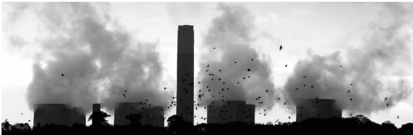
●废气,肆虐地侵占着我们的天空——你看见了吗?