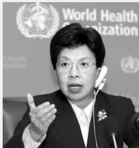
11月9日,陈冯富珍成功当选世界卫生组织总干事