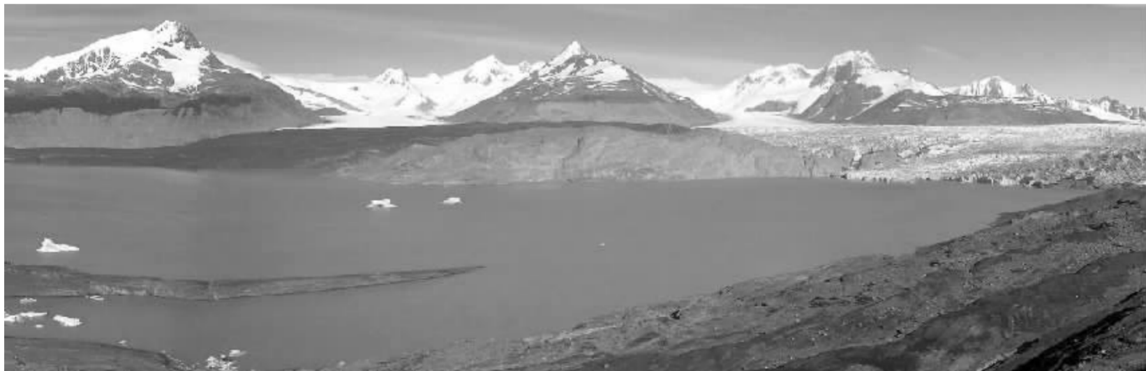
●冰山,正滑落地雪白的薄纱——你注意到了吗?