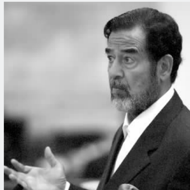
11月5日,伊拉克前总统萨达姆因杜贾尔村案被判处绞刑