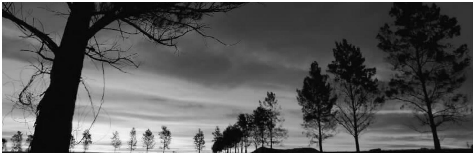
●世界,悄悄地披上了滚烫的外衣——你感觉到了吗?