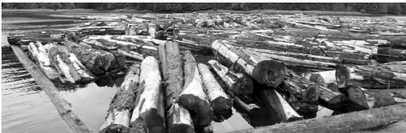
●树木,被无情砍下后无声地叹息——你听到了吗?