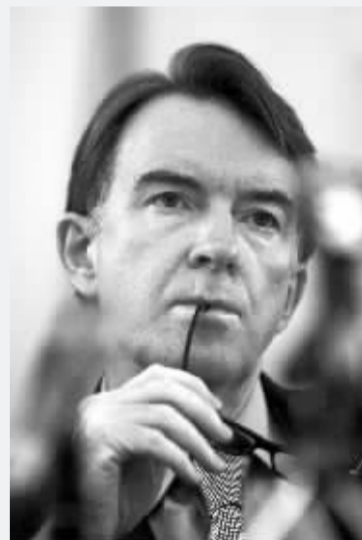
11月6日,欧盟贸易代表曼德尔森一行抵达北京,开始为期一周的访问