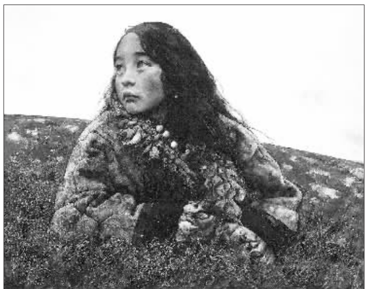
《枯草在寒风中摇曳》艾轩 2001年作

秋渐深而日渐短，这应当算是农历九月的典型气候特征。随着“立冬”节气的到来，再加上一个强大的西伯利亚寒流的助威，寒冷仿佛成了一瞬间的事。连续几天的狂风，结束了达到50年来最高纪录的“暖秋”，也把偌大的北京城送入冬季的门槛，东北地区甚至迎来了第一场雪。