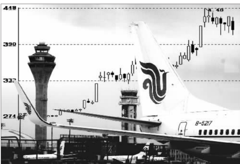
中国国航是蓝筹行情中的一匹黑马 张大伟制图

点又在哪儿呢?其实,三季度组合报告已经揭开了这个秘密。翻开这些基金的组合,招商银行、中国石化、中国国航、上海机场、烟台万华等大盘蓝筹股赫然在列。