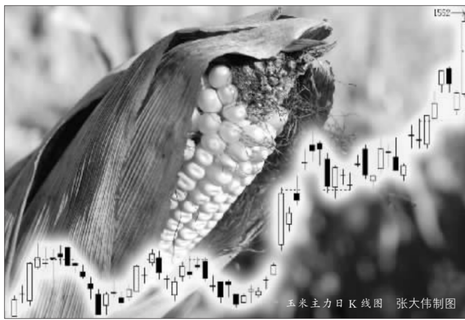
玉米主力日K线图 张大伟制图

相对于多头,玉米主力空头不得不大量减仓止损。空头主力辽宁中期昨天削减空单近6千张,北方期货跌幅最大,空单减少9662张至11010手。