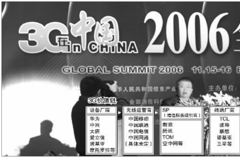
11月15日,“3G 在中国 2006 全球峰会”在京召开 张大伟制图

报告完毕,闻库立刻匆匆离去。这时记者纷纷围堵上去,可是面对记者追问 3G 牌照何时发放的问题,闻司长口