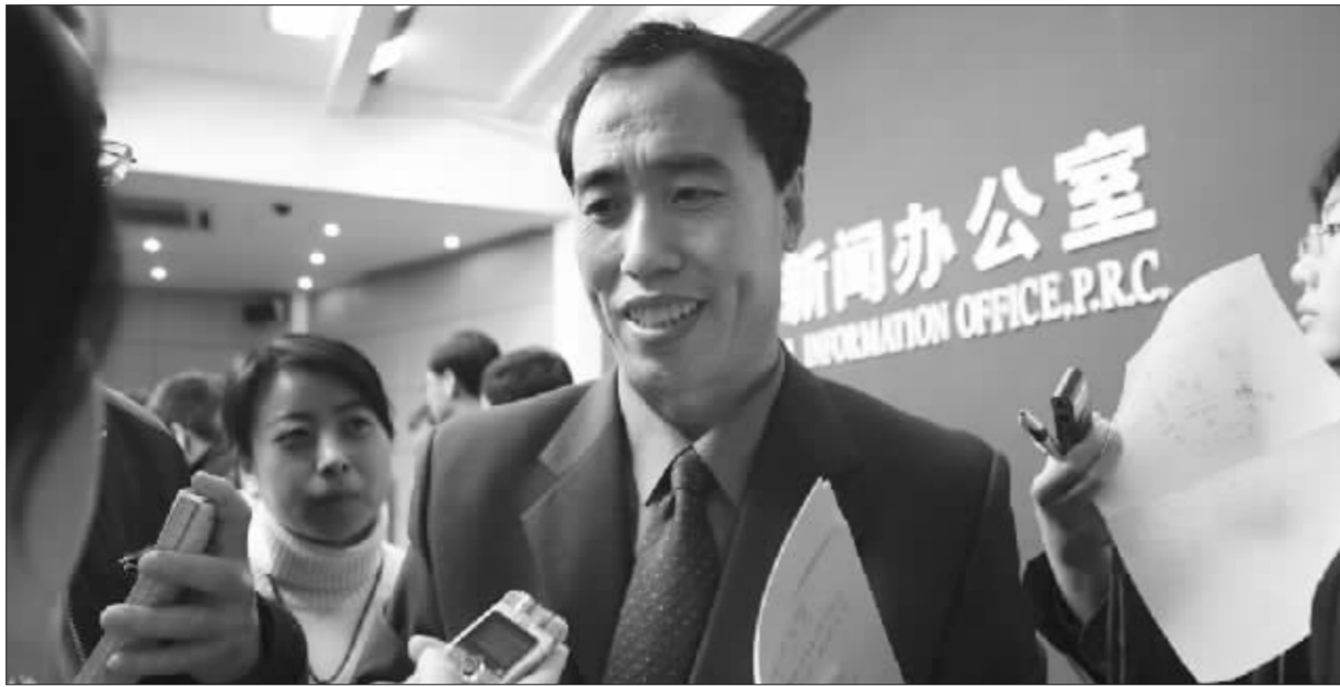
昨日,在国务院新闻办召开的新闻发布会上,银监会主席助理王兆星回答记者提问

■中国将允许外资银行分行吸收中国境内公民每笔不少于100万元人民币的定期存款 ■外资银行转制为中国注册的银行法人以后,可以发行人民币信用卡 ■外资银行分行转为中国内地法人银行后享受与以前同样的外资企业税收政策 ■截至今年9月末,在华外资银行本外币资产总额达到1051亿美元