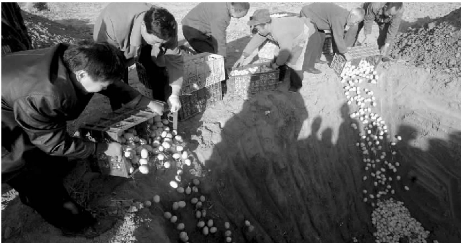
11月15日,在河北省平山县平山镇,人们将“问题红心鸭蛋”倒入坑中掩埋

国家质检总局16日表示,据有关方面对涉嫌“红心鸭蛋”企业的初步调查表明,此次查出的这批“红心鸭蛋”主要销往北京。