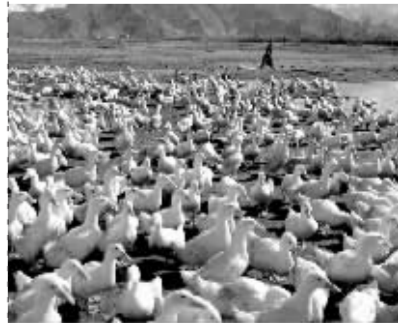
农民养鸭是增加收入的一个途径