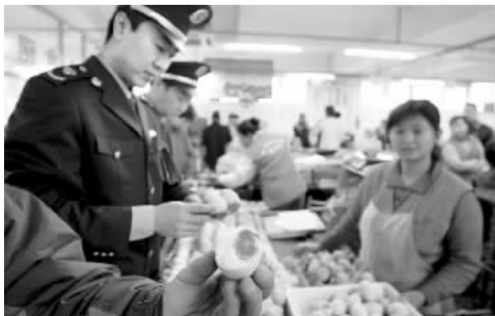
北京市工商局东城分局执法人员在检查鸭蛋

据介绍,目前平山县鸭存栏27750只,通过逐户摸底排查,发现有问题的鸭场5个,鸭存栏5100只,封存“问题饲料”600公斤、鸭蛋310公斤。