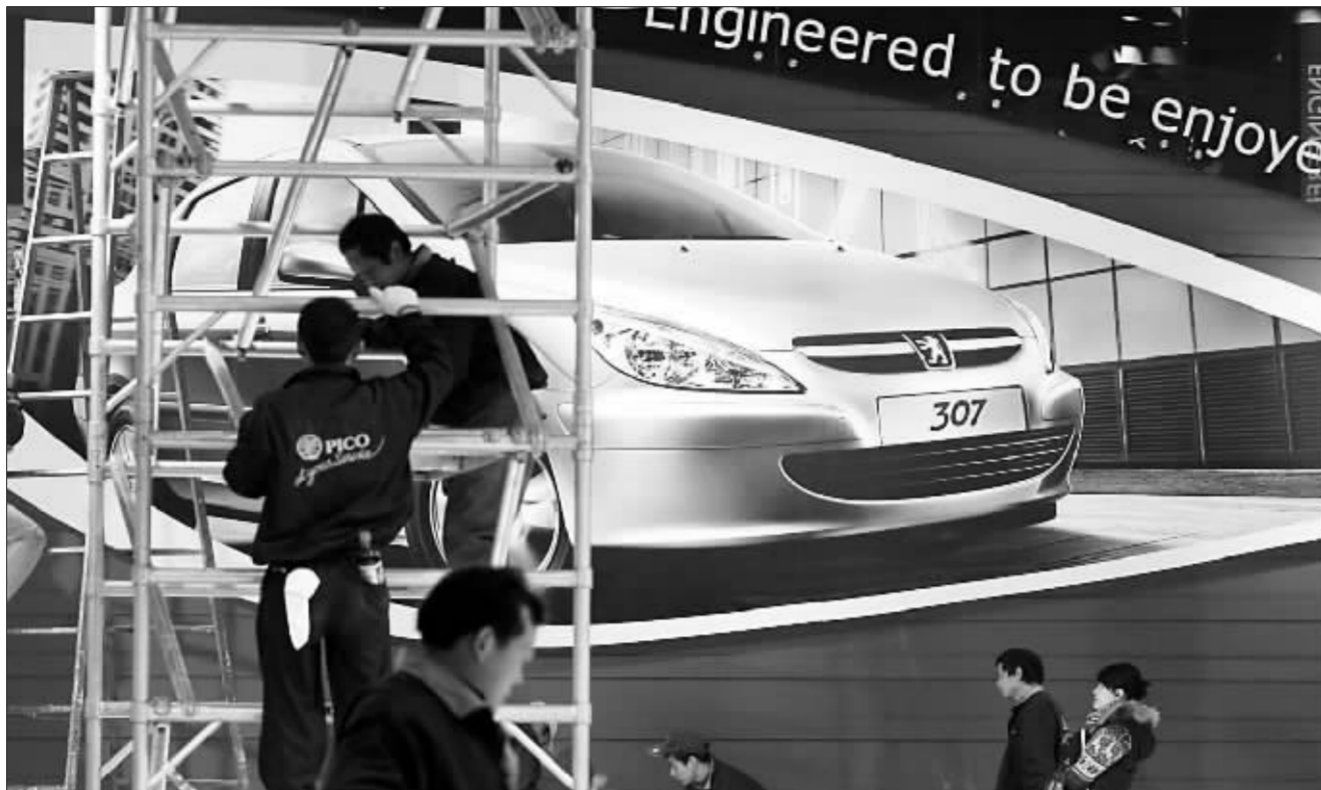
备受瞩目的北京车展今日上演 本报传真图

上海、广州先有强大的汽车制造业基地,再有大型汽车展会。北京却恰恰相反。 实际上,北京汽车工业起步较早,1958年6月,第一辆国产小轿车(“井冈山”牌)就出生在北京汽车制造厂,其后北京又形成了北京第二汽车制造厂、北京内燃机厂等大型零部件企业。