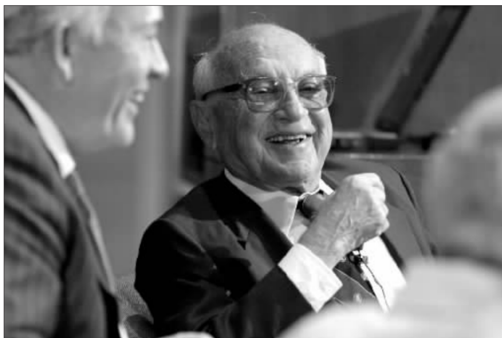
美国著名经济学家弗里德曼16日在美国旧金山逝世 资料图

问中国。他在当时中国浓厚的计划经济氛围下宣传他的自由经济理论,并由此展开了与中国学者的交锋。