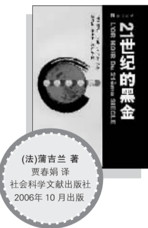
《21世纪的黑金》 (法)蒲吉兰 著 贾春娟 译 社会科学文献出版社 2006年10月出版

曾经是那么神圣、不容侵犯的知识产权,在法国社会经济学家蒲吉兰的眼中却与迅猛发展的仿冒商品一样,已成了“二十一世纪的黑金”。知识产权最初的宗旨是为了支付开发创新者的劳动,而如今知识产权日益商品化,保护知识产权的无形资本已成为企业在全世界市场上的价值来源,专有的知识产权甚至阻碍了科学技术的发展与创新。这场追逐“黑金”的竞赛,已对当今社会造成直接的影响,甚至威胁到了公众自由的权利,比如发展中国家和贫困地区获得基本药品的权利,跨国公司将种子专利化后农民自由选种和种植多种农作物的权利等等,试图将公共互联网据为已有的数码权管理,