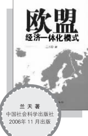
《欧盟经济一体化模式》 兰天 著 中国社会科学出版社 2006年11月出版

当人们回顾20世纪人类历史发展进程时,毫无疑问会把欧盟经济一体化看作是划破历史时空的一个重大的制度创新。欧盟创建了包括经济、政治、金融、科技、社会、外交、防务与司法等各个领域名副其实的全球化一体化区域组织。欧盟经济一体化以其形成时间之早,经济一体化程度之高,参加成员国数目之多,总体经济实力之强,对当代世界经济影响之大,堪称区域经济一体化世界的楷模,而达到这样的境界不仅需要勇气和胆略更需要智慧和谋略。本书用历史演进的方法论述了欧盟经济一体化模式形成的制度基础,并着重分析欧盟经济一体化的模式及其实质和创新,同时阐述了欧盟经济一体化模式的内外效应,