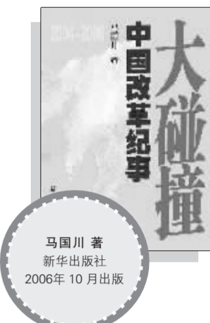
《大碰撞》 马国川 著 新华出版社 2006年10月出版

以新闻视角和大众视角全景式描述中国改革第三次大争论来龙去脉的这本书,是年轻的作者吸收了众多专家意见后改成的第十一稿,足见保持不偏不倚之难。吴敬琏先生把2004年以来的争论称为中国改革的“第三次大争论”。其实,大大小小的争论从来就没有停止过,自邓小平南方谈话终结1990年前后的“第二次大争论”以来,关于“非公有制经济是不是社会主义市场经济的组成部分”以及“能否追问财富原罪”、“私产保护可否入宪”、“私营企业主可否入党”等争论曾一度十分激烈。第三次大争论与第二次、第一次大争论相比,最大的特点就是电脑网络的参与,而“科龙事件”的极端例子