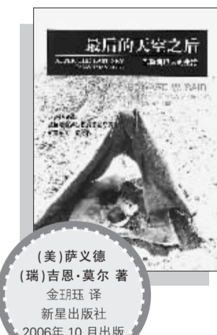
《最后的天空之后》 (美)萨义德 著 (瑞)吉恩·莫尔 著 金星珏 译 新星出版社 2006年10月出版

这个世界,没有一天会少了巴勒斯坦人的新闻。他们的形象似乎被固定化了:要么是凶恶的恐怖分子,要么是悲惨的难民。萨义德在这本怀着强烈的巴勒斯坦认同并带有个人自传性质的书中,则向世人描绘了巴勒斯坦人另一幅感人至深的真实肖像:从以色列的建立到贝鲁特的陷落,巴勒斯坦人在连续的土地剥夺中流离失所,备受苦难。这其中也包括萨义德本人及其亲人的真实遭遇。萨义德告诉人们:新的巴勒斯坦自我身份认同并不建立在流亡和受害者身份上,相反,它将在根植于坚持、希望和被唤醒的共同体感上。现在每当“巴勒斯坦”这个概念在欧美人脑海中闪过时,立即联想到的总是“恐怖主义”,而只有在人们的头脑中改变这种联想时,巴勒斯坦人在现实中对抗以色