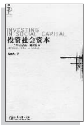
《投资社会资本》 ——政治发展的一种新维度 燕继荣 著 北京大学出版社 2006年5月出版

在历史上,乡土中国是有着较为深厚的社会资本的。费孝通老先生就曾经研究过类似的课题。比如乡土社会,人与人之间信用普遍较好;人们追求“无讼”,服膺于传统的正