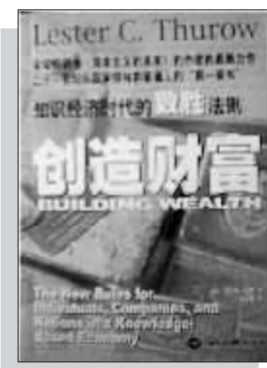
《创造财富》 ——知识经济时代的致富法则 (美)莱斯特·瑟罗 著 世界知识出版社 2001年9月出版

罗丹有言:“生活中不是缺少美,而是缺少发现美的眼睛。”套用这句话,我们大可以说,世上不缺机遇,而缺发现机遇的眼睛。所以,瑟罗把创造财富金字塔的第二要件指向“企业家精神”。他说:“变革需要能认清机遇并能利用机遇的人,需要企业家去认识新技术所带来的经济潜力(如互联网零售),并破除这些潜力实现的障碍。”瑟罗