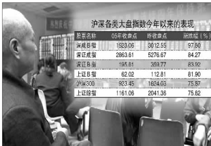
俞险峰制图 张大伟制图

明显缩小, A、B 股股价正逐步接近。来自港澳资讯的统计数据显示,在去年底,沪市 A+B 股公司中 A 股加权平均股价为 4.62 元, B 股加权平均股价(汇率以 1:8.07 计)为 2.18 元,