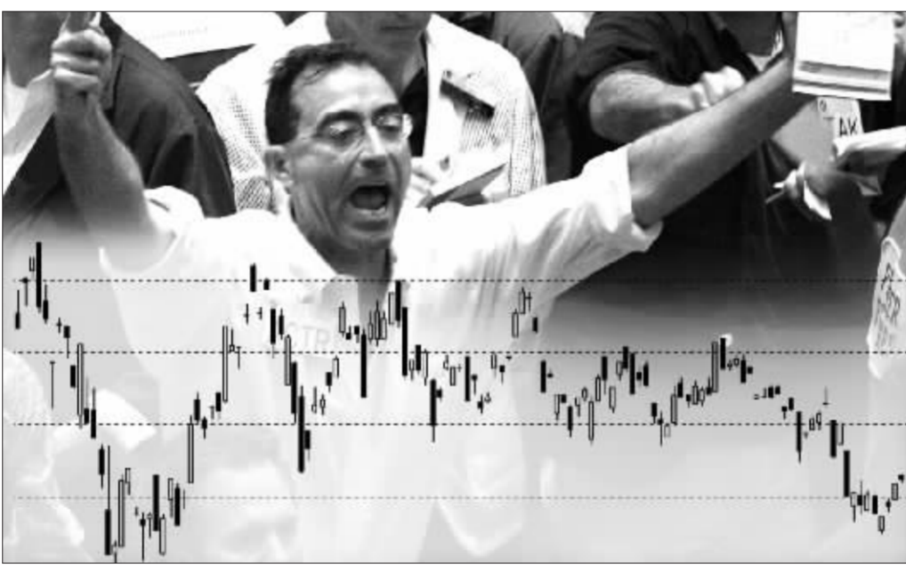
伦敦铜价走势图 张大伟制图

铜价走势可能出现两种形态: 第一种是平行通道构造。即以 9 月 7 日的 8110 美元和 10 月 17 日的 7870 美元为高点形成上轨, 以 10 月 4 日的 7010 美元和 11 月 17 日的 6650 美元为低点形成下轨。其中高点间的时间跨度和低点间的时间跨度基本相同, 这样使得两波下跌行情的幅度均为 1100 点左右, 高点间差距和低点间差距均为 300 点。如果这是一个非常标准的通道, 那么目标位置 7500 美元, 大致时间期在 11 月 16 日至 12 月初。而目前, 市场在 7000 美元之下有形成复合双肩的倒头肩底的可能, 如果市场滑向 6900 美元以下, 则右肩的第二个肩完成, 铜价冲破