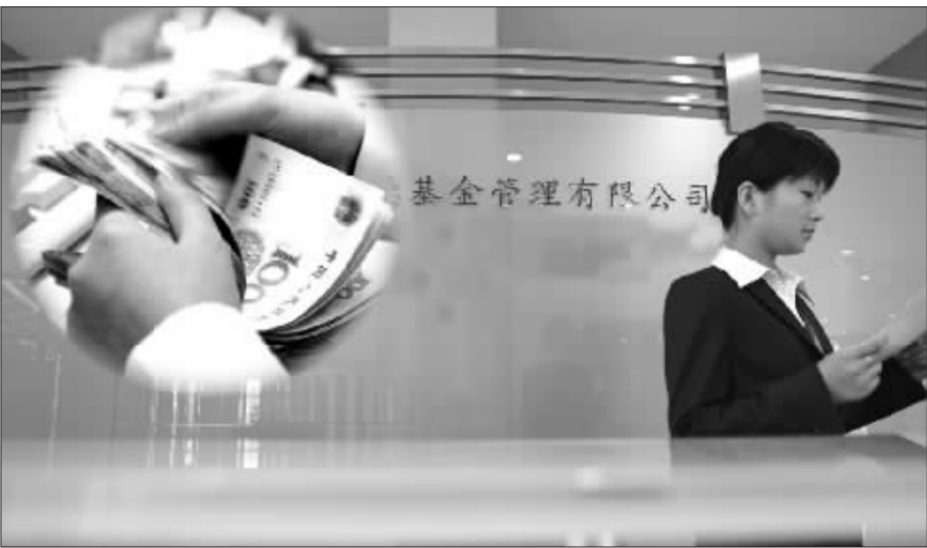
基金公司的财务状况一直是业内关注的焦点 徐汇 资料图 张大伟 制图

基金公司盈利状况到底如何?最近披露的数据显示:基金业虽然不是人们想像的暴利行业,但其投资回报率仍然较为可观。去年基金公司股东所获得的投资回报率达到了7.12%,而今年随着股市大幅升温,相信会有更好的收成。