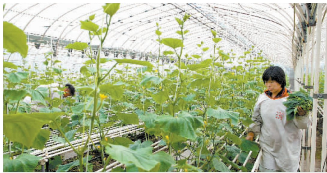
SST中农以农产品开发为主,二股东股权之争会不会对公司的未来产生影响? 资料图

然而,新华锦源于2006年11月21日就SST中农2006年度第一次临时股东大会召开