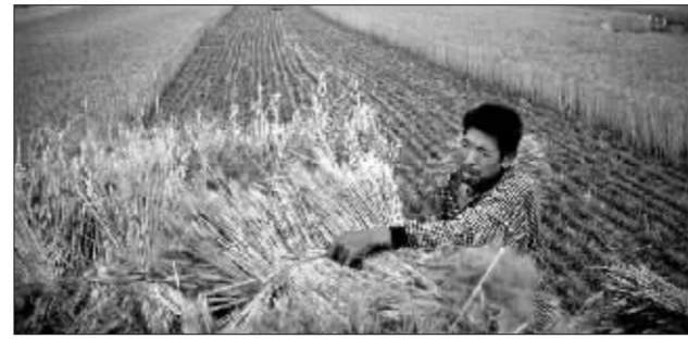
小麦大丰收,国家储备充足 资料图

与12月1日举行的第三次托市小麦竞价相比,昨天小麦的成交价格基本持平,总成交率也比较接近。业内人士认为,目前国内小麦充足,4000余万吨储备粮只要加强管理,足以应对粮油价格出现的任何变化。