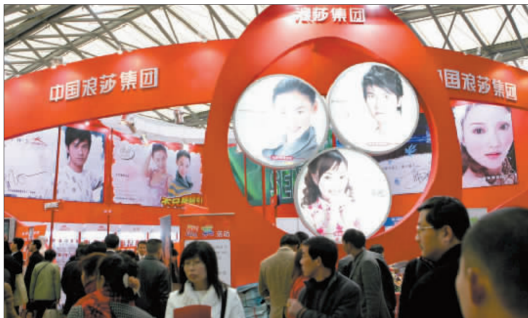
浪莎有意入主,让人们对S*ST长控有了新的期待 徐汇资料图

一笔高达18942.9万元的资产赠与,不仅曾给予了S*ST长控重组曙光,而且也创造了资本市场的一个并购神话。然而,6年之后神话最终破灭,在多年诉讼纠纷后,S*ST长控终于宣布解除公司与原重组方四川泰港签订的《资产赠与协议》。S*ST长控今日发布公告称,经四川省高院认定,四川泰港对中岩公司的土地资产进行了虚高评估,对S*ST长控进行虚假的资产赠与。同时,青神县人民政府因四川泰港违反其在土地出让、投资等协议中所作的声明与承诺条款,2002年11月22日,已经收回了中岩公司的经营权及其他权利。因此,根据相关规定,公司将该赠与合同受赠的中岩公司95%股权返还给四川泰港,并保留索赔因此所受到损失的权利。这一备受瞩目的资产赠与事件源于6年前,为了避免被PT,S*ST长控从2000年上半年开始突击资产重组,公司第一大股东分别与四川泰港实业(集团)、西藏天科签订了《股权托管