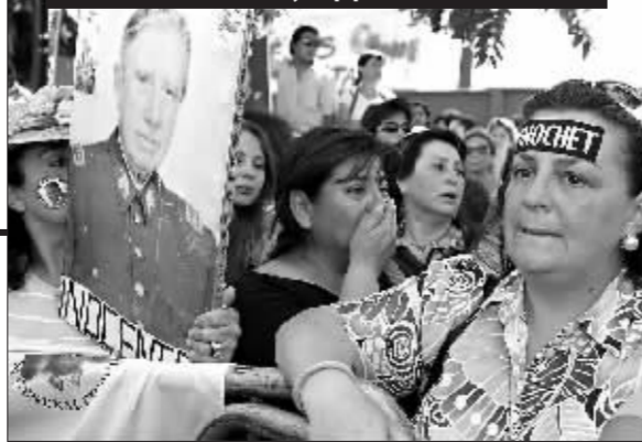
支持者街头悼念皮诺切特