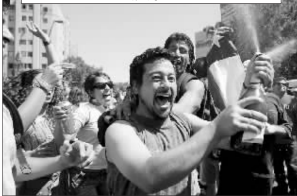
反对者庆祝皮诺切特去世 本报传真图