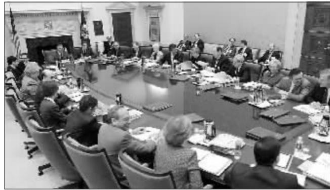
美联储将迎来年内最后一次货币政策例会 资料图

瑞士信贷亚洲首席经济学家陶冬认为,除非房价急跌,否则美联储在调整利率时会格外谨慎,不会“轻举妄动”,因为任何加息或是降息的举措都可能代表了一种新