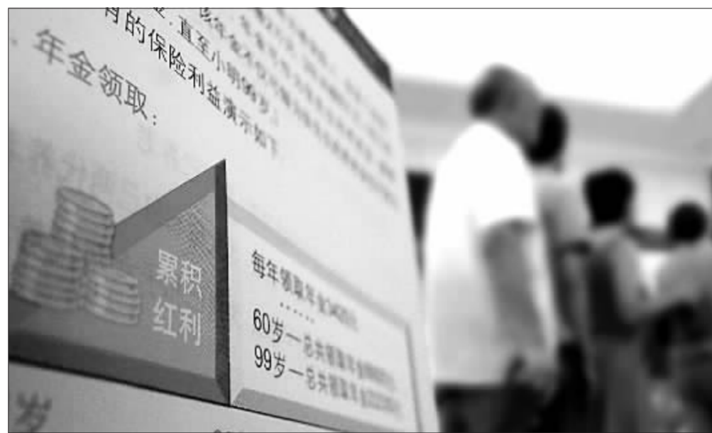
中国基本养老保险支出显著增加,养老保障财政压力加大 资料图

第五,加强人口老龄化的战略研究。立足本国国情,同时积极借鉴他国和地区应对人口老龄化、解决老龄问题的经验。