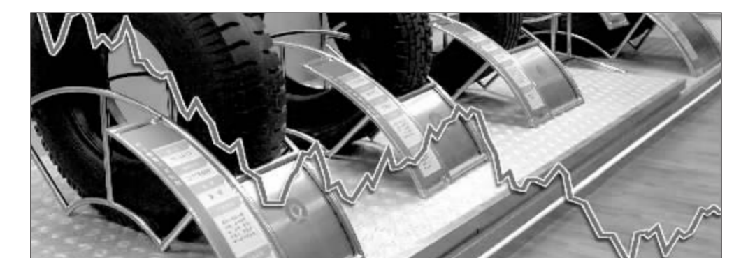
沪胶主力走势图 张大伟制图

昨日0703合约上空方排名第一的是浙江中大;排名第四的是浙江永安;排名第五则是浙江大地。浙江资金正在沪胶市场激烈厮杀。综观昨日交易状况和期价走势,尽管早盘东京期胶价格显示下跌走势,但沪市期胶在相对低位震荡中再度显现上涨势头,其中主力0703合约价格一路上涨至高点18550元;午盘中东京期胶价格继续下跌且跌幅继续扩大(其中基准5月期约价格下跌至2093日元/公斤),压制沪胶期价从当日相对高点回落。但较东京期胶的跌幅,沪胶价格明显较为坚挺,主力0703合约价格低点也