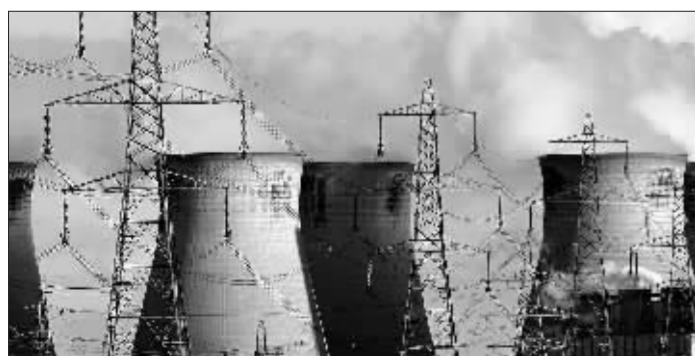
明年经济工作将注重降低污染物排放量