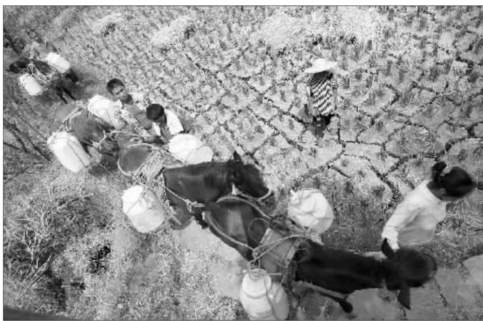
直到12月中旬,广西、河南、浙江等地还在坚持抗旱 资料图