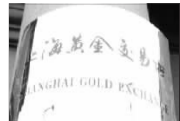
申万成为黄金交易所券商会员还是件“没谱”的事 资料图

员分为三类:金融类、综合类和自营类。金融类会员可进行自营和代理业务及批准的其它业务,综合类会员可进行自营和代理业务,自营会员可进行自营业务。券商的申请即使通过,究竟成为哪一类会员,以目前的管理条例来看,也比较难以分清。