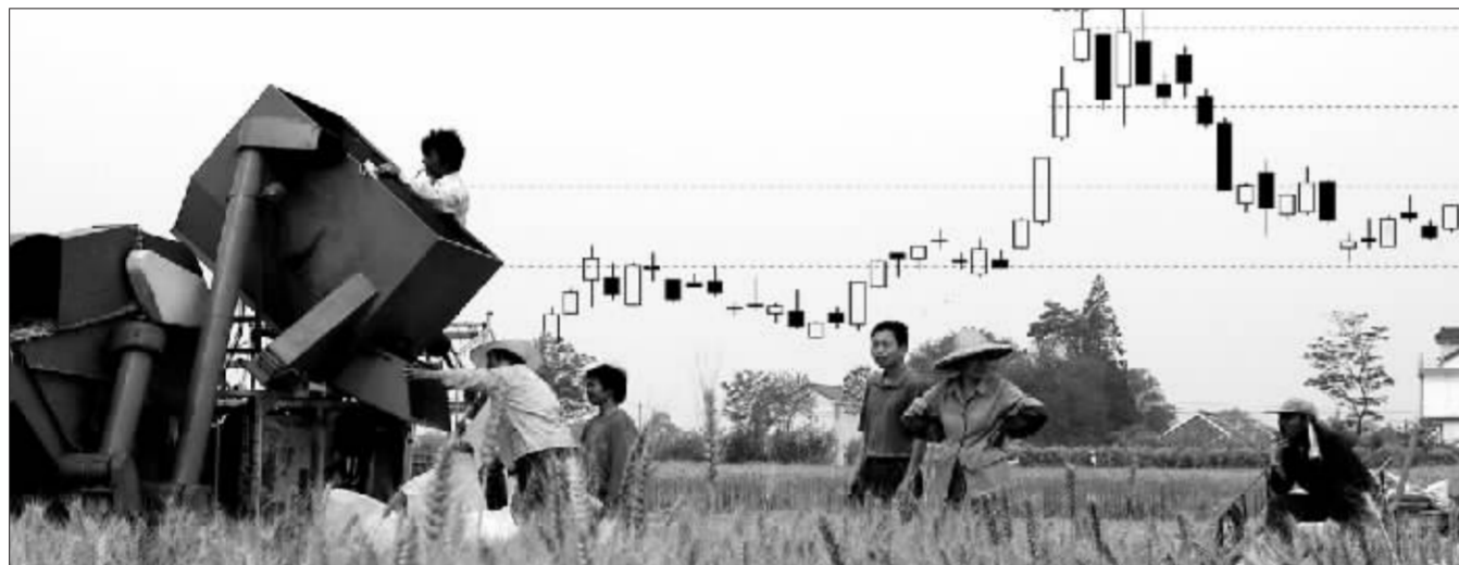
郑州强麦走勢圖 張大偉制圖

昨日国内期货市场对此拍卖结果的反应是上涨。郑州商品交易所强麦尾盘拉高,主力合约0709收报1886元/吨,与上一交易日相比上涨25点,涨幅为