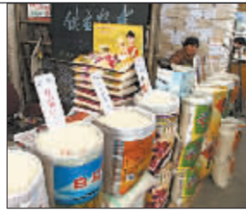
宏观调控“组合拳” 遏制粮油涨价