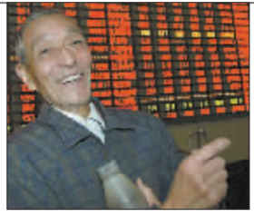
沪深港股 三大指数齐创新高