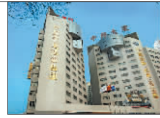
中国交通建设 昨登陆港交所