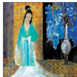
7 上海泓盛秋季拍卖 “油画雕塑”专场