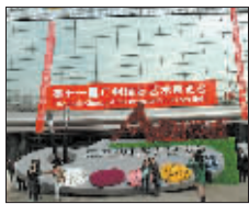
6 广州艺博会 赶集去