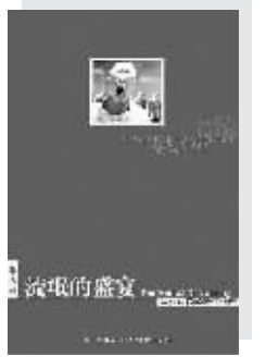
朱大可著 新星出版社2006年11月出版

这是一部关于这个时代(1980—2005)的个人观察备忘录,历经三年写作,游走了将近60家出版社才得以面世。作者将当代中国分为两个社会:国家社会与无秩序、无信仰、无权威和无道德的流氓社会,后者以离开土地的两亿流氓为基础,成为当代中国的隐形属性。从这一点出发,作者深入探讨了盛行于当代中国的流氓话语现象。对渗透在各种文化样式(小说、诗歌、美术、音乐及大众文化等)之中的流氓叙事模式,展开独特新颖的阐释,揭示流氓话语的基本特征,梳理、厘清旧有“流氓”一词的数千年历史、语义以及它的符号意义,痛斥“色语”的空前发达,哀惜“灵语(精神叙事)”的严重失踪,并给属于“广义流氓学”的一系列