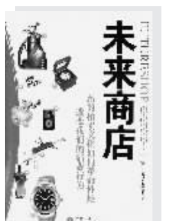
(美)丹尼尔·尼萨诺夫著 张岩 魏平译 中信出版社2007年1月出版

在线拍卖辅助公司Portero的创办人丹尼尔·尼萨诺夫大胆预测即将来临的拍卖文化革命:围绕eBay产生的拍卖现象将会革命性地改变所有消费者购物的方式。消费者可以随意购买自己真正想要的物品,同时也会出售那些不想要或者不需要的东西。无论是购买路易威登手提包、成套卡拉威高尔夫球杆,还是高中品质的百乐水晶,都是精明买家的明智选择,而不再是一种奢侈或者放纵。在新消费方式下,二手订婚戒指与买二手的Google股票之间将不存在任何区别。现在大家看到的还只是开始,它将由由此产生一系列新型企业,而消费者将在这些新式服务中获得最大程度的购物满足感,精明的企业家则可以利用这些便