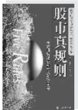
《股市真规则》 The Five Rules for Successful Stock Investing (美)帕特·多尔西著 司福连 刘静译 中信出版社2006年1月出版

2、寻找具有强大竞争优势的公司。“竞争优势有助于你把竞争对手挡在外面。如果你识别出