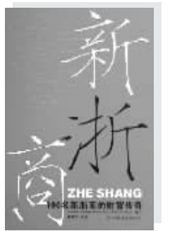
陈康汉著 中国友谊出版公司 2006年12月出版

“温州帮”、“绍兴帮”、“宁波帮”——浙江是一个具有炽热企业家精神的地方,浙商们在没有机会的地方会创造出机会,在有机的地方能抓住机会。在当今中国,以郭广昌、杨国平、陈天桥、陈邓华等人的名字为代表的浙新商形成一个最健康、最有生气的经济群落,他们今天的成就完全可以媲美全球最成功的华裔。因为浙江商人都有比较强的市场意识,更因为浙商有着一股不屈不挠的拼搏精神,喜欢不断地给自己设定新的目标,历史的、地理的、文化的多种因素,养成了他们不等等不靠,相信市场,相信自己的独立精神和自立性。因此之故,浙江经济已被编入许多发达国家的经济教科书里,美