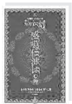
《盛噶仁波切心得》 华文出版社2006年1月出版