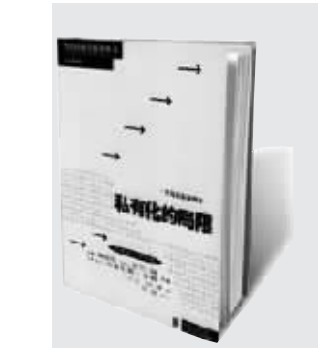
《私有化的局限》 (德)魏伯乐等主编 周纁 王小卫译 上海人民出版社2006年3月出版 上海高等教育图书公司出品

随着我国改革的深化和社会转型的加剧,市场必然会在更多的领域发挥更大作用,但如果此时面对市场的失灵,政府不该无为而治。