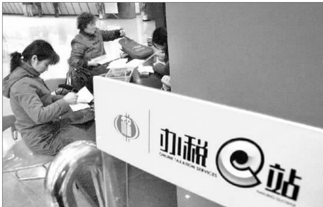
财政部将通过税收调节力度,缩小贫富差距,扩大中等收入阶层比重 资料图

金人庆表示,下一步财政部将进一步完善和规范公务员收入分配制度,规范国有企业收入分配秩序,加大税收调节力度,缩小社会贫富差距,扩大中等收入阶层比重,努力形成“橄榄型”的收入分配格局。