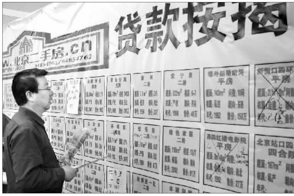
央行昨日公布的调查结果显示,北京、上海等大城市居民购房意愿回落 史丽 资料图

本季度贷款需求景气指数仍处于高位,达66.6%。个人消费贷款需求景气指数小幅上扬,并升至全年最高。除个人消费贷款外,其他各类贷款投放景气指数均延续下降走势,并降至全年最低。调查还显示,政策性银行、国有商业银行反映贷款需求增长的比重最高;与上季相比,除政策性银行与外资银行反映贷款需求增加的比例有所提高外,其他各类银行较上季都有所下降。