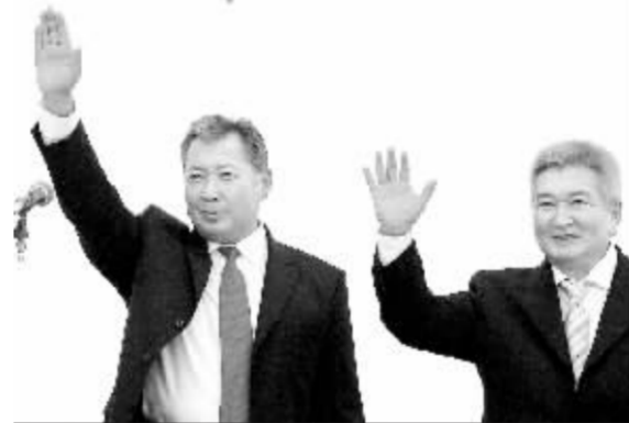
总统巴基耶夫和库洛夫(右)在一起 资料图

此外, 吉尔吉斯斯坦的一系列重要工程建设项目也无法在议会获得通过。按照计划, 吉可能将在明年