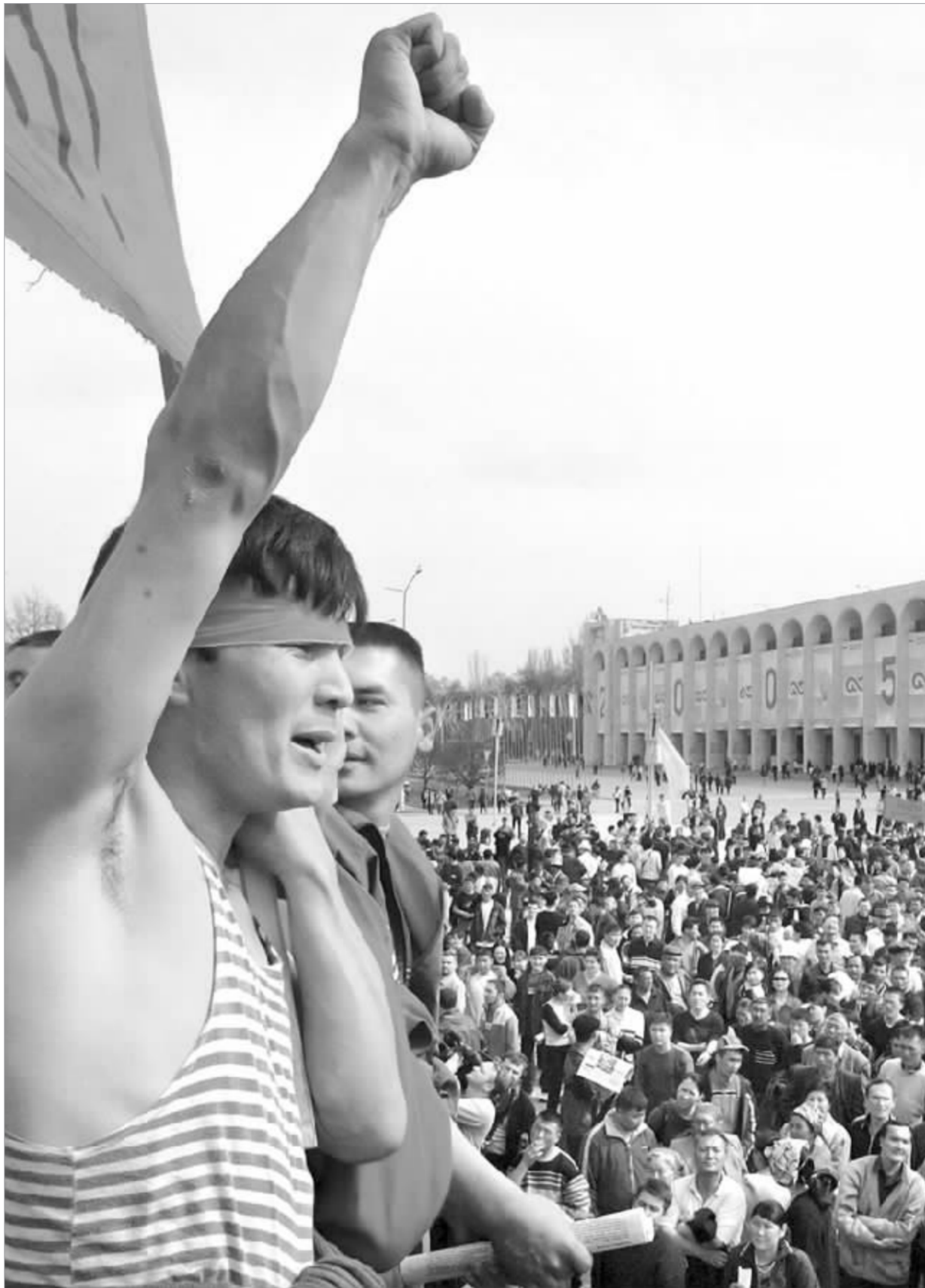
自去年爆发“颜色革命”以来, 吉尔吉斯斯坦政局一直动荡。图为反对派游行反对政府 资料图