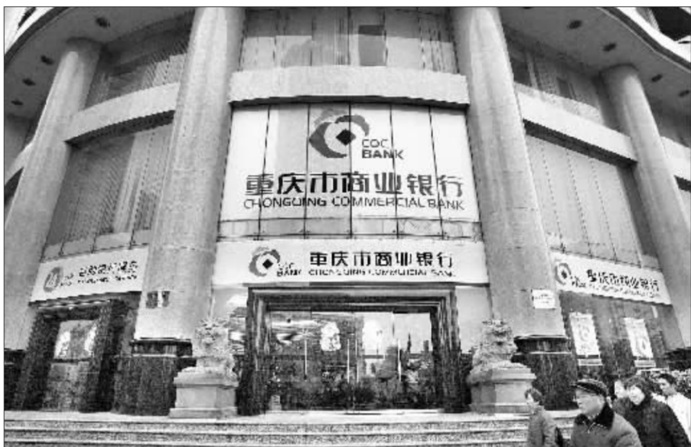
引入海外投资者之后,重庆商业银行将很快启动上市日程

12月21日,重庆市希尔顿酒店。 在重庆市政府、国资委及银监部门的大力推动下,重庆市商业银行(下称重庆商行)与香港大新银行签下第一纸《战略合作协议》,美国凯雷投资基金同时也以财务投资者身份入股重庆商行。在优质金融资源稀缺的时代,重庆商行顺利成为了中国西部携手外资的首家城市商业银行。 不过稍感意外的是,大新银行此前并没有人选重庆商行进行考察的战略投资者名单。 在昨日的人股签约会上,重庆渝富资产管理有限责任公司(下称重庆渝富)和大新银行、凯雷投资基金同时签订了《股权转让协议》。根据协议,大新银行和凯雷投资基金分别以战略投资者和财务投资者身份,购得重庆商行17%和7.99%的股份。由此,此次外资入股总额达到24.99%,重庆商行也成为在银监会监管条件约束下外资入股数额最高的商业银行之一。 而大新银行和凯雷的出线,直至消息公布时依然让人意外。本月初,包括摩根士丹利、花旗银行、新加坡华侨银行、德国D.E.G.投资公司、荷兰银行和香港中银国际银行在内的六家所谓“最后角逐者”还在重庆商行引入外资的考察之列。 重庆商行董办人士谈及此事,话中颇有意味,“不到最后一刻,一切皆有可能”。 据悉,大新银行是香港上市银行,在港设有分行40多