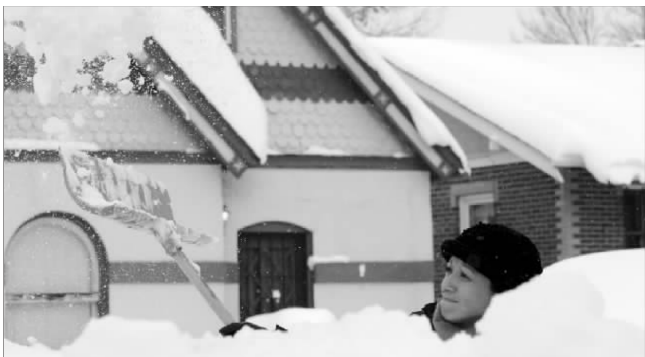
暴风雪过后,丹佛市民在清理积雪