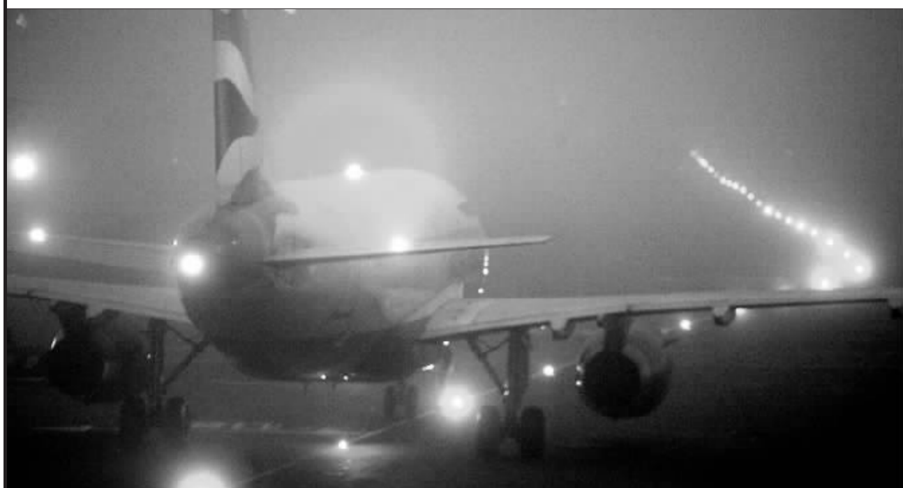
由于伦敦遭遇大雾天气,英国航空公司取消了大量航班 本报传真图