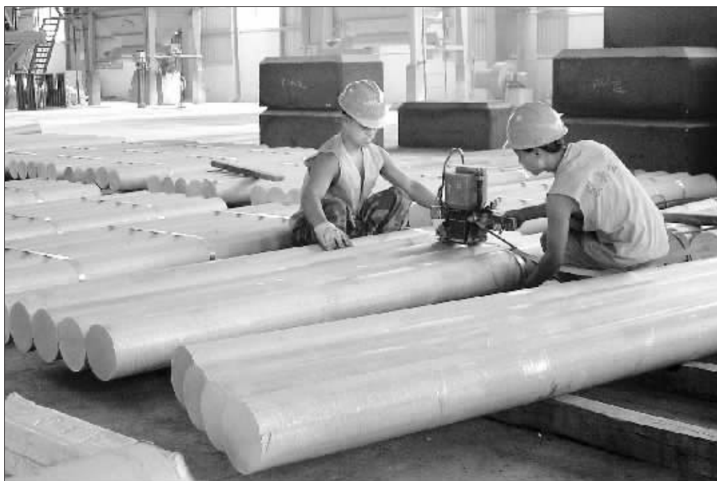
目前国内闲置铝产能启动加速 资料图

出口减少,由于加征关税出口受到抑制,1至10月国内累计出口电解铝72万吨,同比下降26.9%,一定程度上减少了国际市场电解铝的供应量。