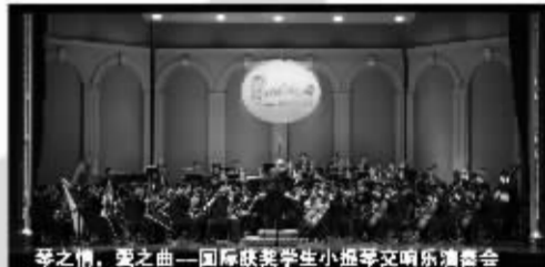
琴之情·爱之曲——国际钢琴学生小提琴交响乐演奏会