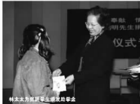
林太太为贫困学生颁发助学金