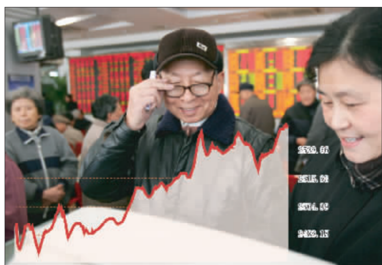
上证综指站上2500点再创历史新高 张大为 制图