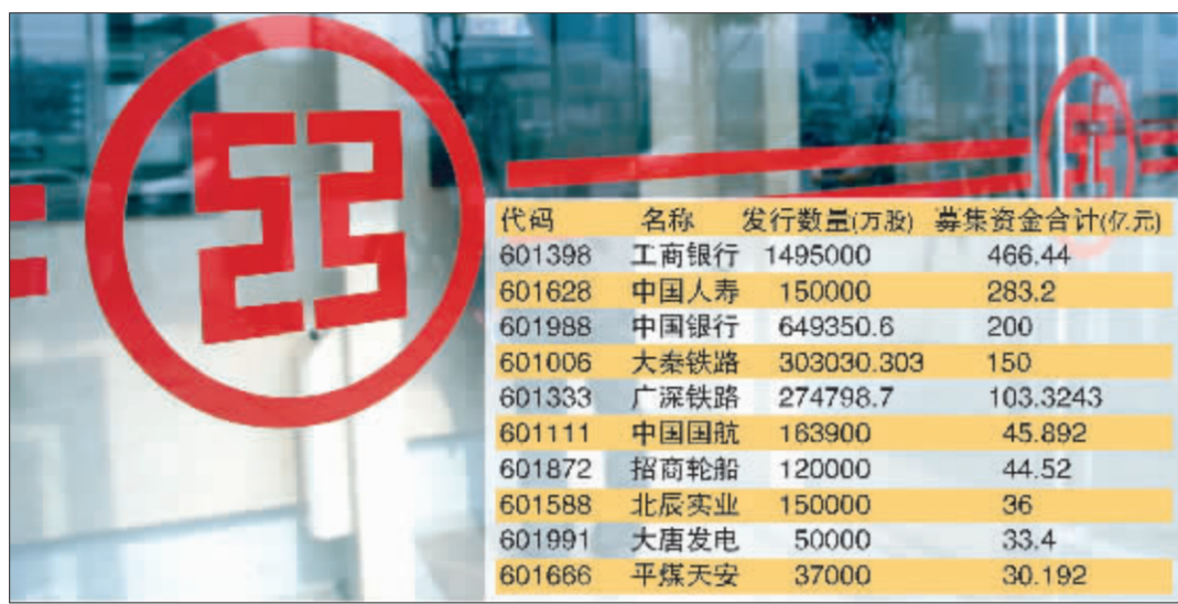
工行等大盘股引领股市稳步上扬 张大伟制图

截至目前,今年有 63 家企业通过 IPO 募集资金 1337.96 亿元,其中以工商银行、中国银行等为代表的 14 家大盘蓝筹企业共募集资金 1169.42 亿元,占比 87.4%。如果把即将结束发行工作的中国人寿也计算在内,这一比例将逼近九成。在今年最为火爆的再融资方式——定向增发环节,45 家已公告实施定向增发的企业总募集资金 932.44 亿元,其中有 15 家定向增发由大股东以股份认购或募集资金用于收购大股东资产,涉及资金为 646.44 亿元,占比 69.3%。如果将上港集团换股吸并上港集箱也计算在内的