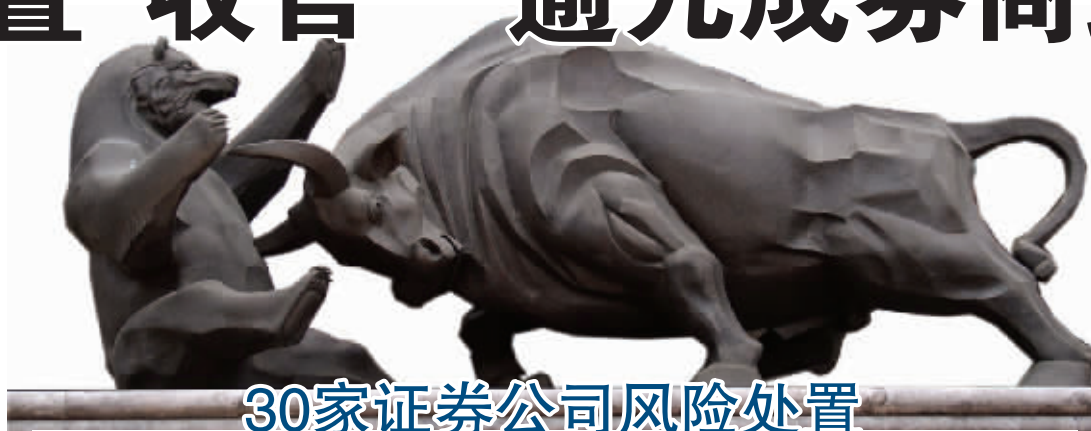
30家证券公司风险处置

据悉,在券商风险处置过程中,有关部门协同各方力量共同推进工作,主要形成了7种券商风险处置模式,即股权转让、增资扩股、吸收合并、证券类资产出售、关闭、撤销和破产重整。其中,除关闭、撤销两种方式外,大多数券商采取了股权转让及增资扩股方式解决风险;大通证券、天元证券、华泰证券等通过吸收合并处置风险;第一证券、中期证券等为证券类资产出售方式。值得