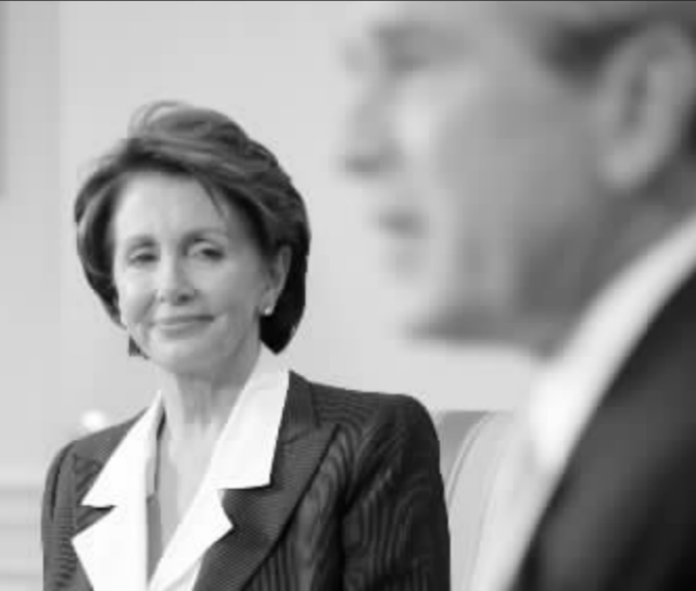
佩洛西(左)领导的国会与布什政府针锋相对 资料图

除此之外,专家还指出,在政治上,美国的新国会也可能在人权或是宗教问题上对中国加以指责。“中美两国的意识形态不一致,中国很容易成为美国政客攻击的靶子。”潘锐说。