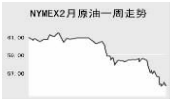
以上4图截止时间为1月5日19:15 本版制图:郭晨凯 数据提供:李强