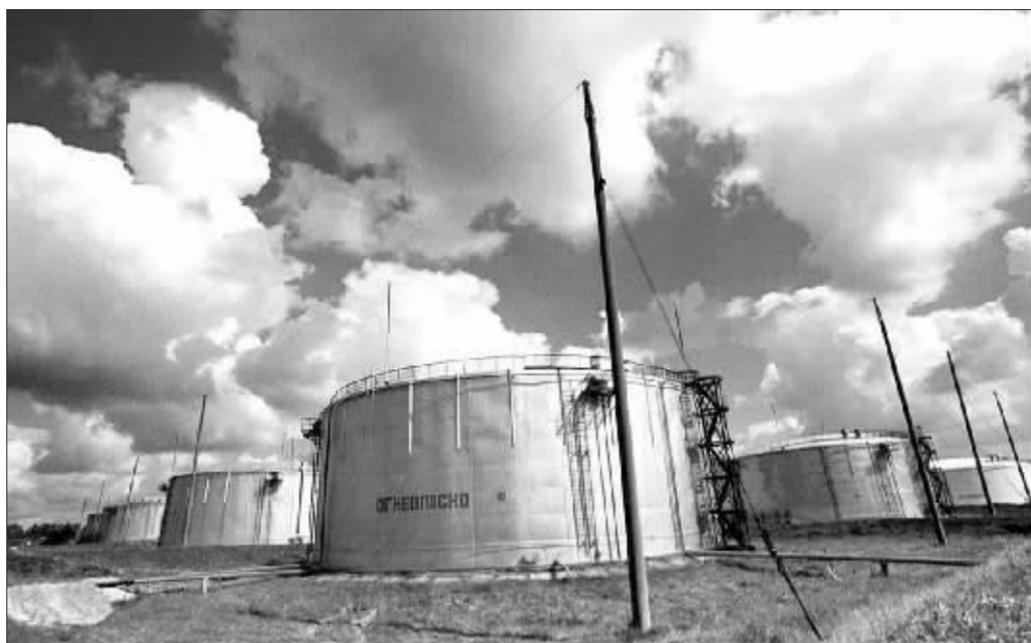
位于白俄罗斯南部城市的油库 资料图

不过,留给俄罗斯和白俄罗斯解决问题的时间似乎也不会很多。波兰负责能源事务的经济部副部长纳伊姆斯基8日就表示,如果俄罗斯经由白俄罗斯向波兰输油的管道继续断流,波兰将向俄罗斯提出赔偿要求。