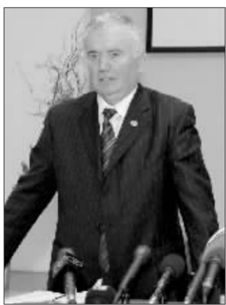
白俄罗斯石油管道负责人阿列克谢·科斯塔琴科 新华社图