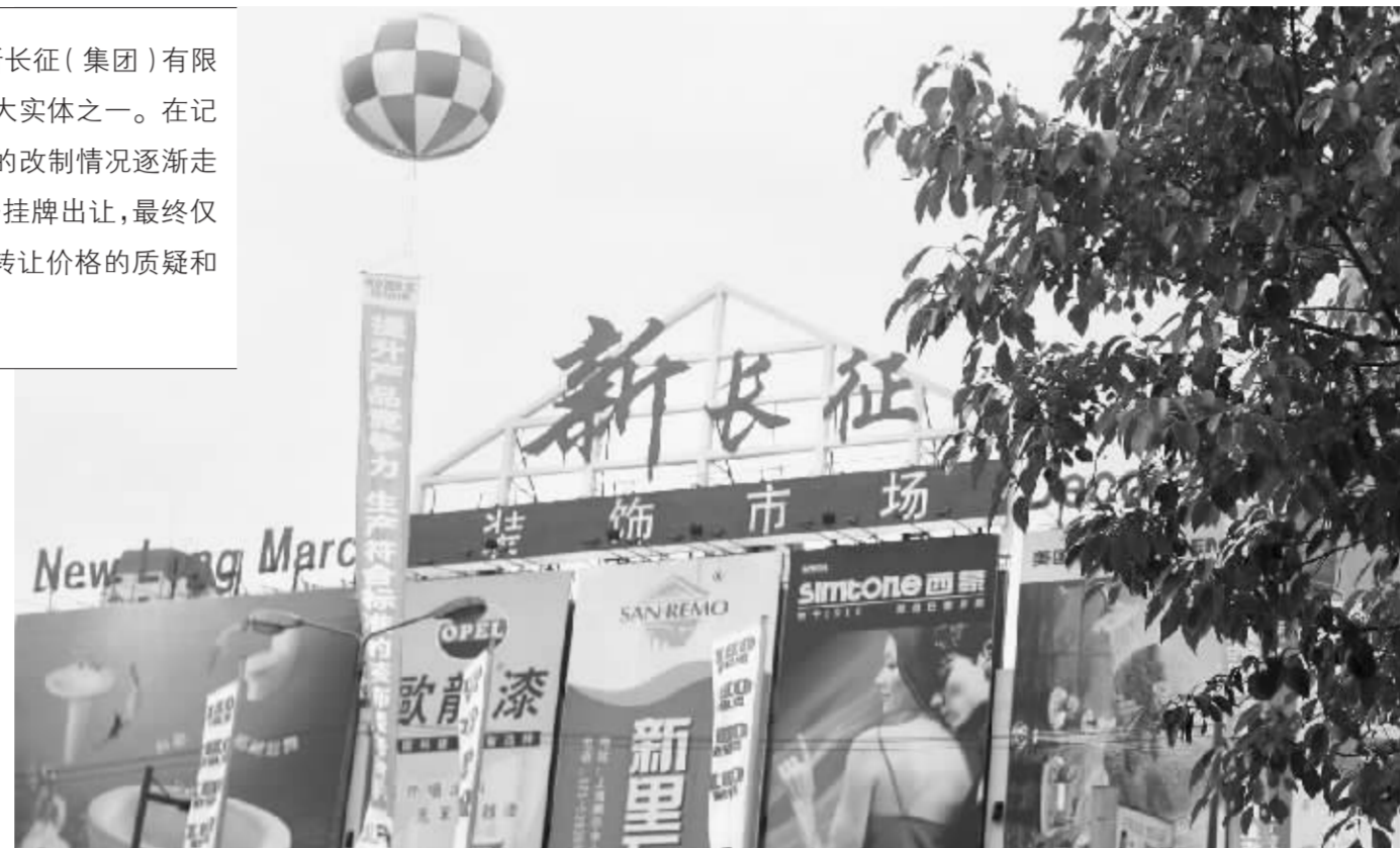
工、农、商多头发展的新长征集团曾有辉煌的业绩 资料图

从新长征的年检报告来看，新长征的经营情况每况愈下——从2000年至2004年，工商年检中的公司税后利润分别为5700万元、650万元、750万元、113万元和188万元，到2005年，审计报告称公司亏损额近6000万元，而且其中最主要的亏损来自股权投资。